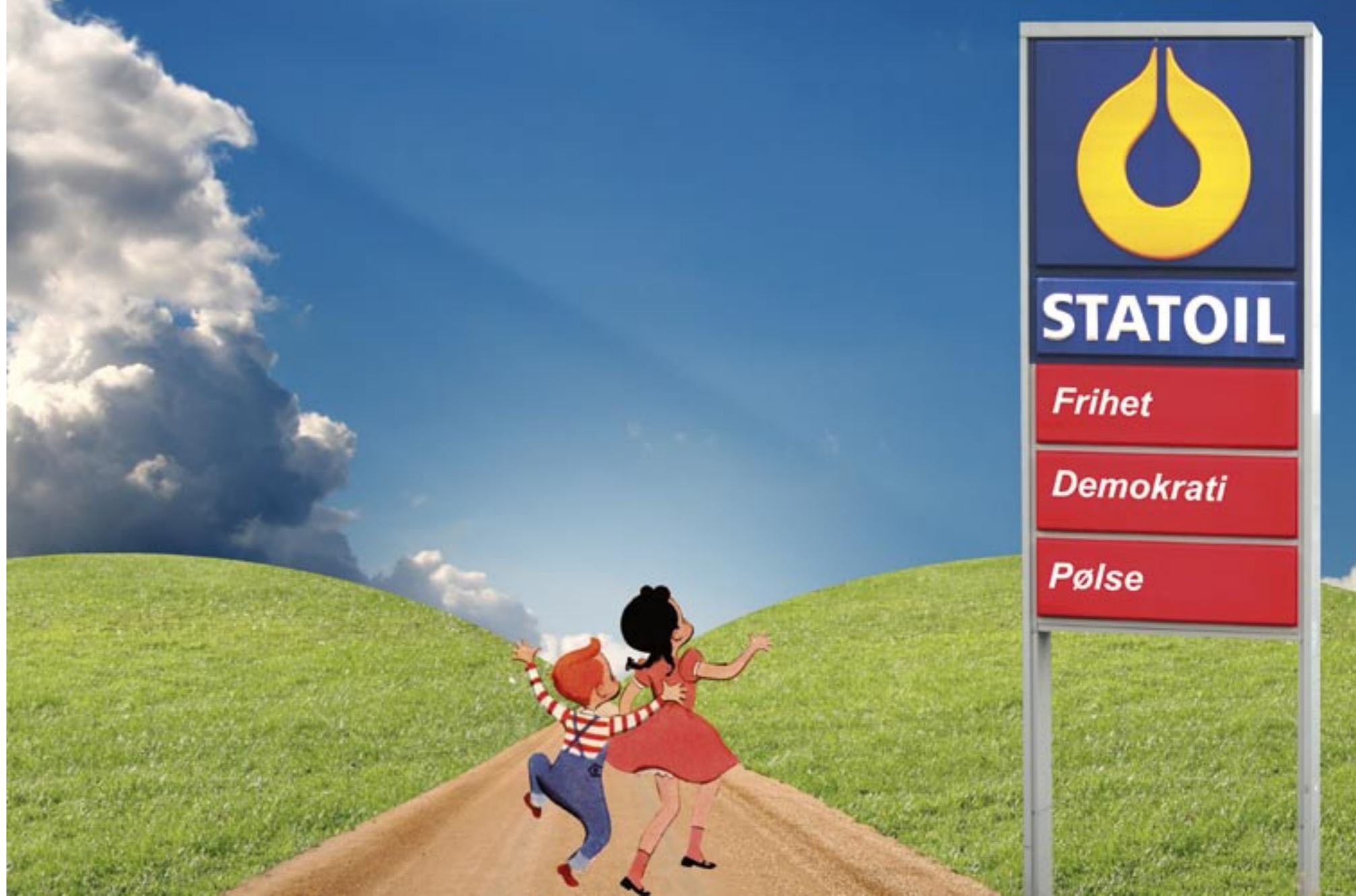
Illustrasjon: Bjarne Henning Kvaale

Har skrevet masteroppgave om Corporate Social Responsibility.