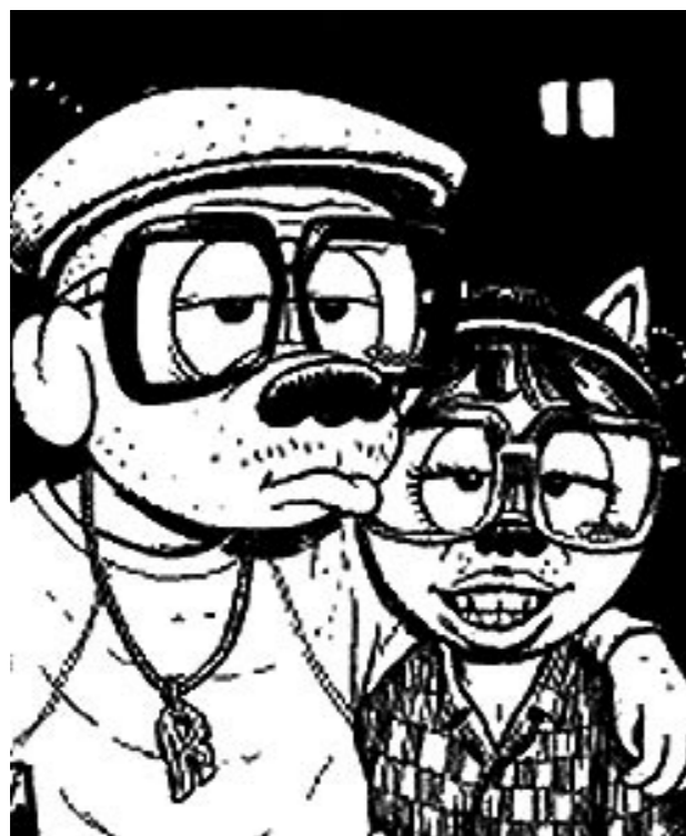
Rocky – The Big Payback av Martin Kellerman oversatt av Dag Gravem Schibstedforlagene, 2005

Masterstudent lingvistikk, UiO, skriver oppgave om filmanmeldelser.