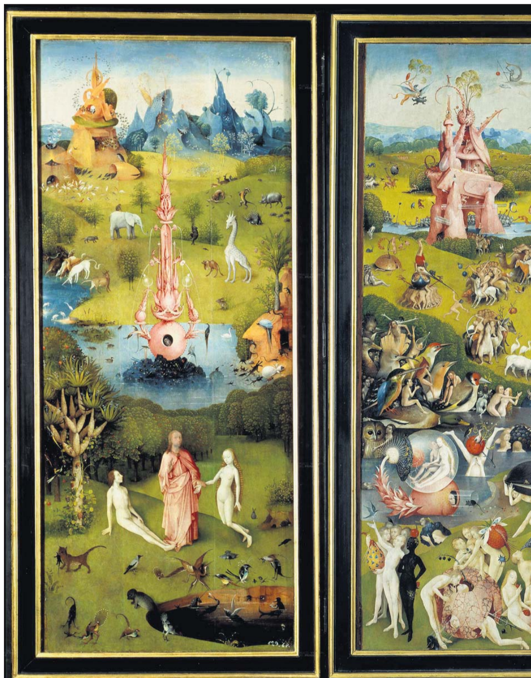
ALTERNATIVT PARADOKS: Tilhengere av alternative behandlingsmetoder nekter ofte å underlegge

Mange av behandlingsformene tyr til en eller annen form for energi eller energifelt som skal